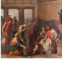
Le Jeune Pyrrhus à la cour de Glaucias, 1791