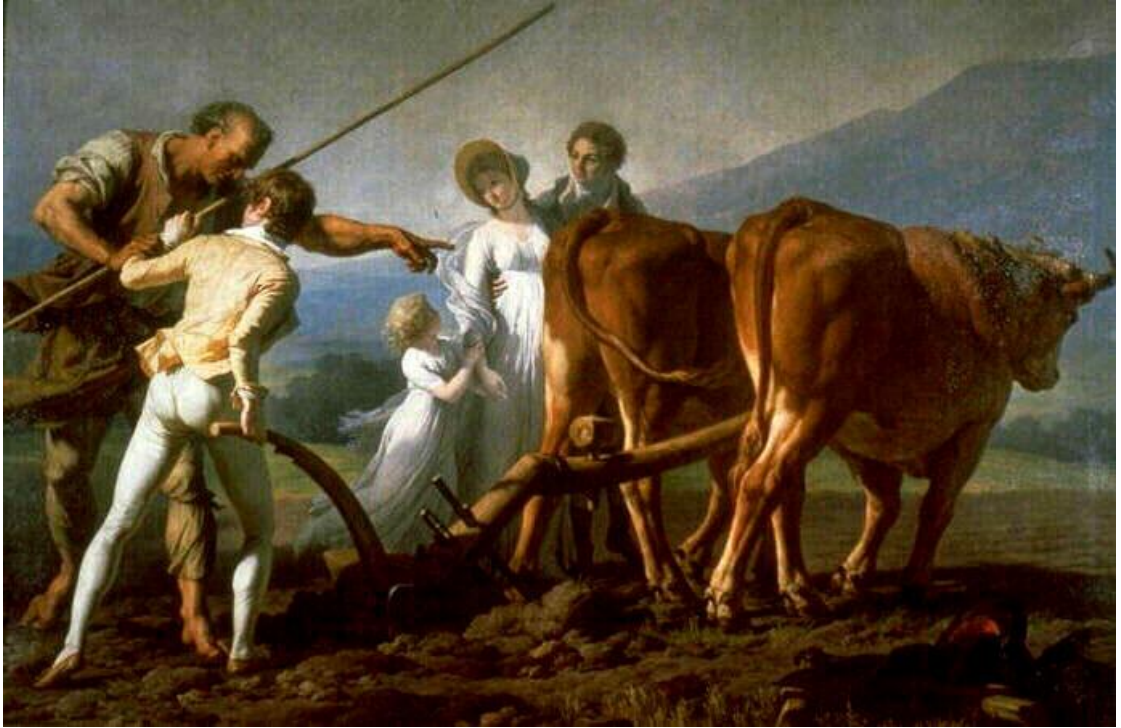
VINCENT François-André, La Leçon de labourage , 1798 213 x 313 cm Bordeaux, Musée des Beaux- Arts