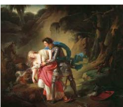
Renaud et Armide, réplique du tableau du Salon de 1787