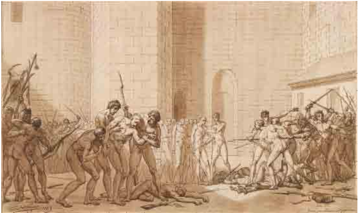
Scène de la prise de la Bastille, 1789, Dijon, musée des Beaux-Arts.

Avant la fin de 1789, VINCENT réalise un grand dessin, Scène de la prise de la Bastille . Les figures étant représentées nues et avec un grand soin, technique utilisée par VINCENT pour la préparation de ses œuvres peintes, on peut supposer qu'il s'agit du projet d'un tableau.