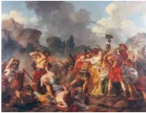
Les Sabines, ou Le Combat des Romains et des Sabins interrompu par les femmes Sabines, 1781