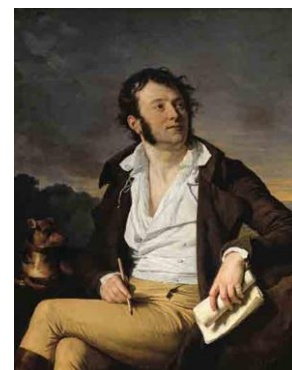
Portrait du poète Antoine-Vincent Arnault , 1801, Versailles, musée et domaine national des châteaux de Versailles et de Trianon.

C'est aussi au goût anglais que ressortit l'aspect « campagnard » du portrait, ce plein air qui est autre chose qu'un fond pittoresque et évocateur, mais un milieu dans lequel baigne la figure. Il faut prendre garde à la dangereuse notion de pré-romantisme qu'invite à évoquer le tableau. Mais il y a bien ici le thème de l'écrivain inspiré qui va devenir un poncif . » 12