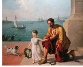
Allégorie de la libération des esclaves d'Alger par Jérôme Bonaparte, 1806