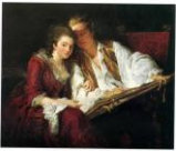
La Leçon de dessin, 1774