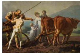
L'Agriculture, dit La Leçon d'agriculture ou La Leçon de labourage, 1797-1798

5- Des pistes pour construire un itinéraire « Histoire