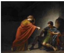
Arria et Poetus, 1784