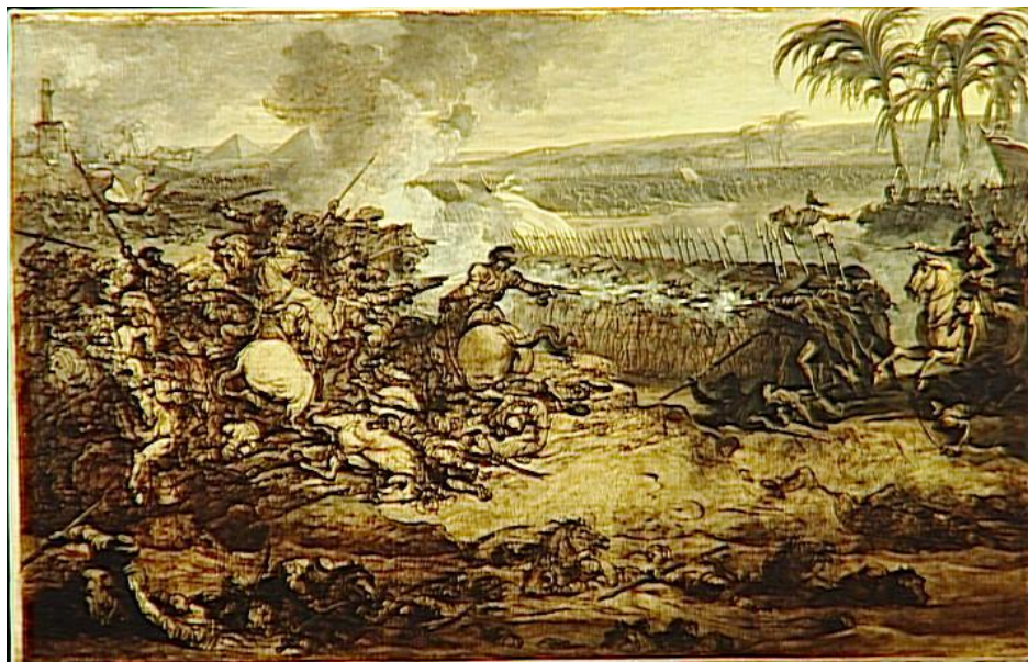
VINCENT François- André, La Bataille des Pyramides , 21 juillet 1789. Vers 1800, 80 x 125 cm France, Paris, Musée du Louvre.

Par ailleurs, afin d' exalter la « gloire nationale » , VINCENT propose d'augmenter la taille des œuvres et fait preuve d'un souci documentaire immense ; il sollicite même le Premier Consul pour obtenir des renseignements de première main « sur les mouvements des troupes, les vêtements des Mamelucs armés en guerre... ».