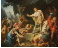
Germanicus apaisant la sédition dans son camp, 1768