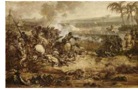
La Bataille des Pyramides, grisaille, 1801