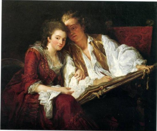
VINCENT François- André, La Leçon de dessin ou Un jeune homme, donnant une leçon de dessin à une demoiselle, 1774 France, Paris, Collection particulière.