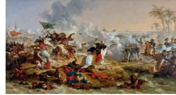
La Bataille des Pyramides, 1810