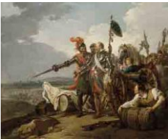
Henri IV devant Paris ou Henri IV laissant entrer des vivres dans Paris, 1783-1784