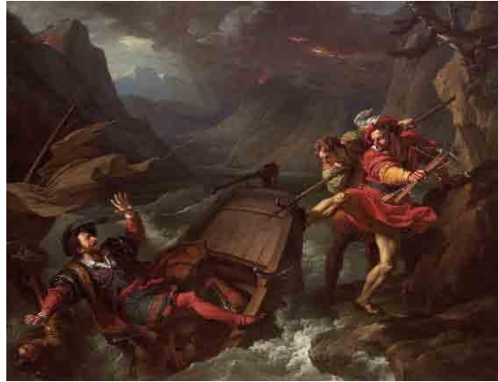
Guillaume Tell et Gessler, 1795, Toulouse, musée des Augustins.

L'étude du Guillaume Tell et Gessler de VINCENT, présenté au Salon de Thermidor (1795) permet d'aborder la question de la représentation des idées républicaines et de montrer que celles-ci peuvent trouver d'autres chemins d'expression plastique que le néoclassicisme .