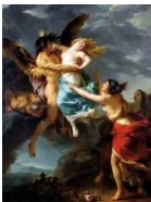
L'Enlèvement d'Orythie, grande version, 1781-1782