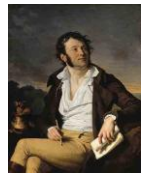
Portrait du poète Antoine-Vincent Arnault, 1801