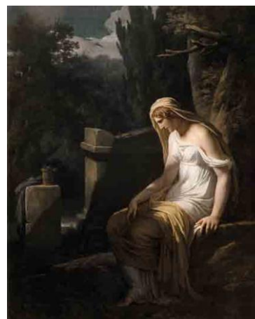
La Mélancolie , 1800-1801, Rueil-Malmaison, musée national des châteaux de Malmaison et Bois Préau.

La Mélancolie est une œuvre nocturne ; là réside toute sa nouveauté et son originalité qui rappellent le premier romantisme allemand de Caspar-David Friedrich (1774-1840).