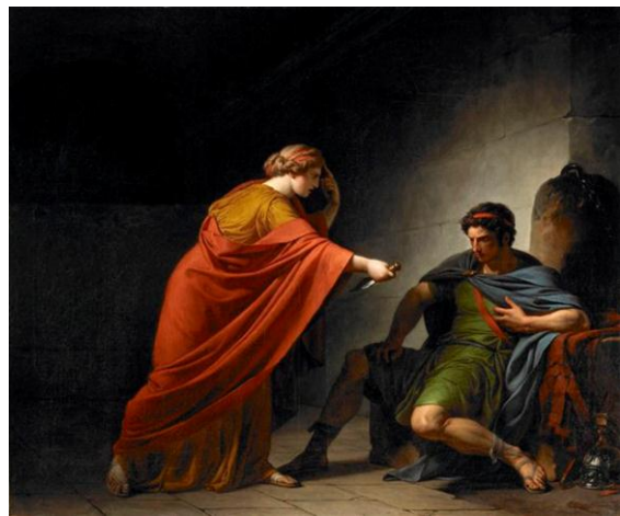
VINCENT François- André Arria et Poetus se donnant la mort 1784 Huile sur toile 101 x 121,9 cm Saint Louis, Saint Louis Art Museum

Par ailleurs, cette activité permet d'évoquer, à travers la question des styles , les influences de VINCENT.