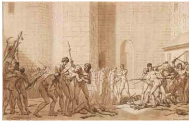
Scène de la prise de la Bastille, 1789