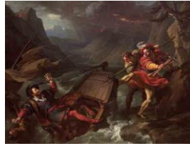
Guillaume Tell et Gessler, 1795