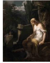
La Mélancolie, 1801