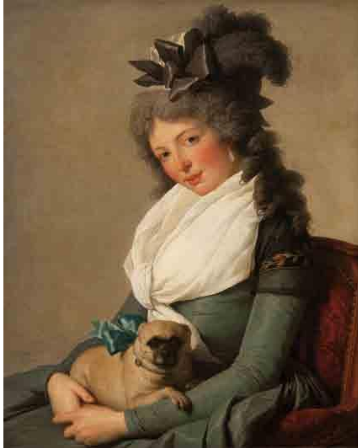
Portrait de jeune femme assise, à mi-corps, un chien sur ses genoux, dit Portrait de madame Dugazon, 1793, Grande-Bretagne, collection particulière.

La période révolutionnaire infléchit donc la production de VINCENT vers un genre dans lequel il excelle: le portrait . La Terreur constitue également un moment d'épreuves éprouvantes pour le peintre. En effet, sa compagne, Adélaïde LABILLE-GUIARD, ancienne portraitiste attirée de Mesdames et du comte de Provence, avait réalisé une série de portraits de députés, dont celui de Robespierre. Ces députés furent envoyés à l'échafaud car considérés comme des modérés. En août 1793, une partie des tableaux de LABILLE-GUIARD fut même détruite au motif qu'ils étaient des « signes de féodalisme ».